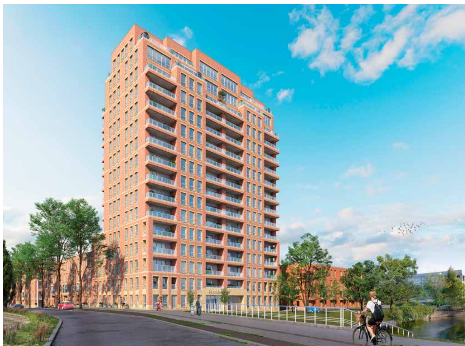
De hoge woontoren en het binnenplein.

De nieuwbouw ligt weliswaar in het Energiekwartier, maar het bureau Geurst & Schulze heeft ervoor gekozen het ontwerp meer bij de huizen aan de singelgracht aan te laten sluiten. Geurst: "We hebben ons laten inspireren door de negentiende-eeuwse wijken die overal rond het centrum liggen. Het ligt zo nadrukkelijk aan de Noord-West Buitensingel, dat we vinden dat het ontwerp meer op de binnenstad ge-