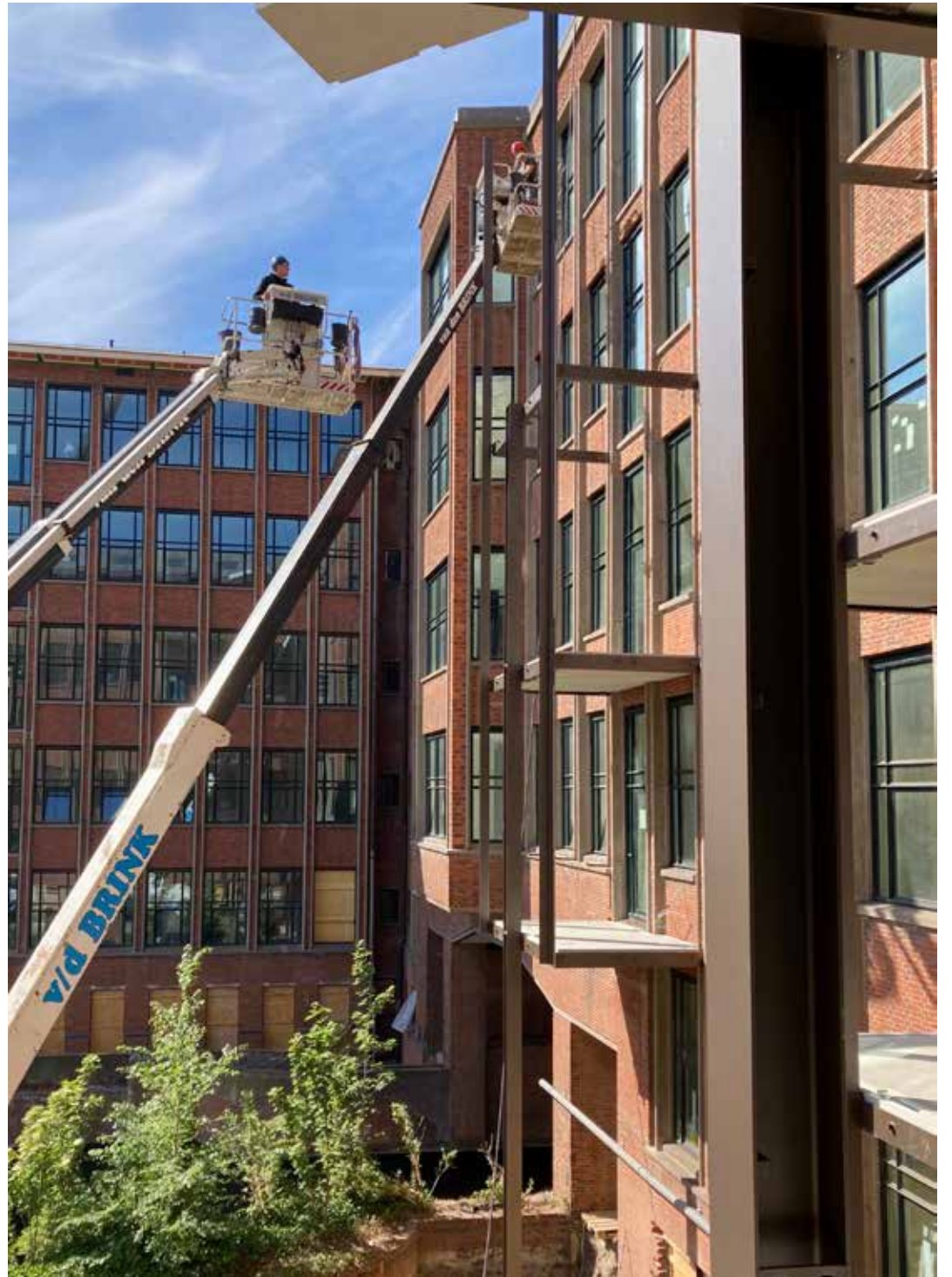
Op de verdiepingen wordt met een stalen constructie buitenruimte toegevoegd.

Waarmee wel verbinding is gezocht tussen het monument en de nieuwbouw, is de plek in het landschap. "Het nieuwe complex aan de kant van de hoofdentree vormt straks sa-