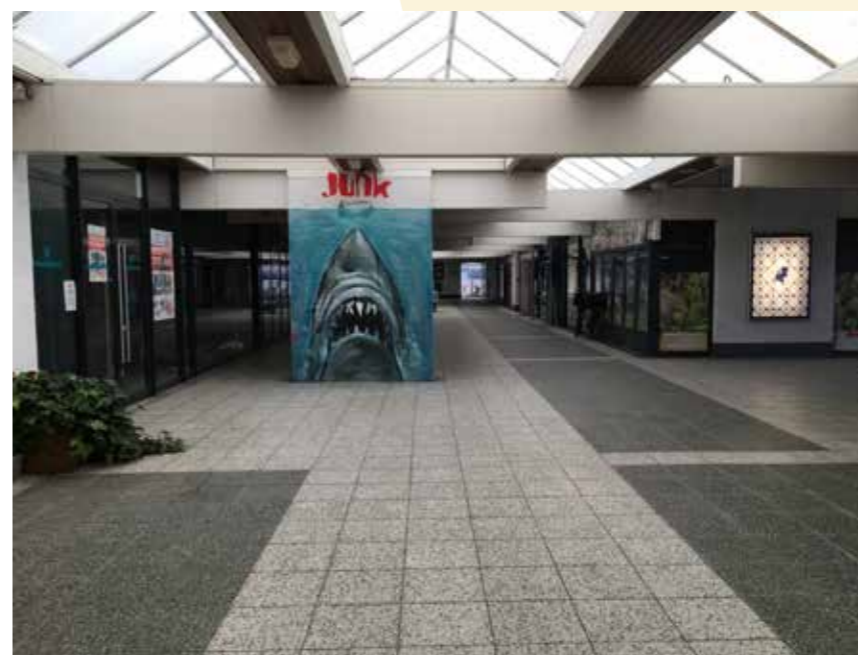
WINKELCENTRUM KIJKDUIN 1980-2019