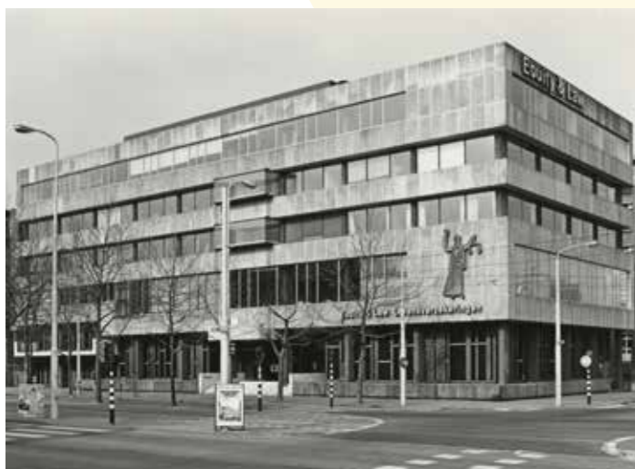
KANTOOR EQUITY & LAW Le Grand & Selle 1973-2013