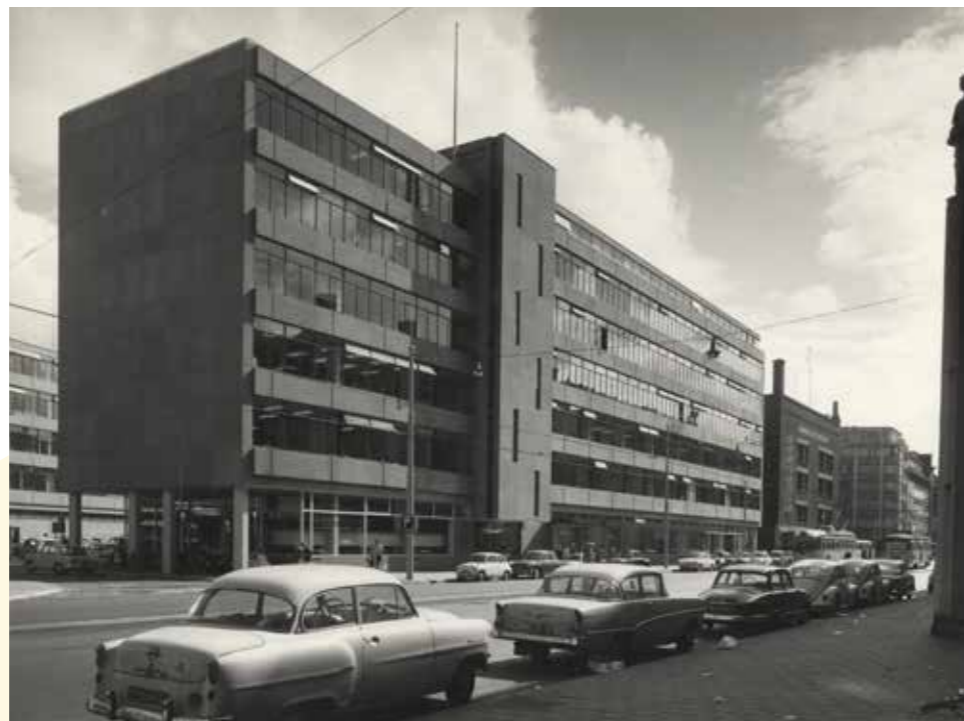
LUMMUS NEDERLAND Van den Broek en Bakema 1965-1988