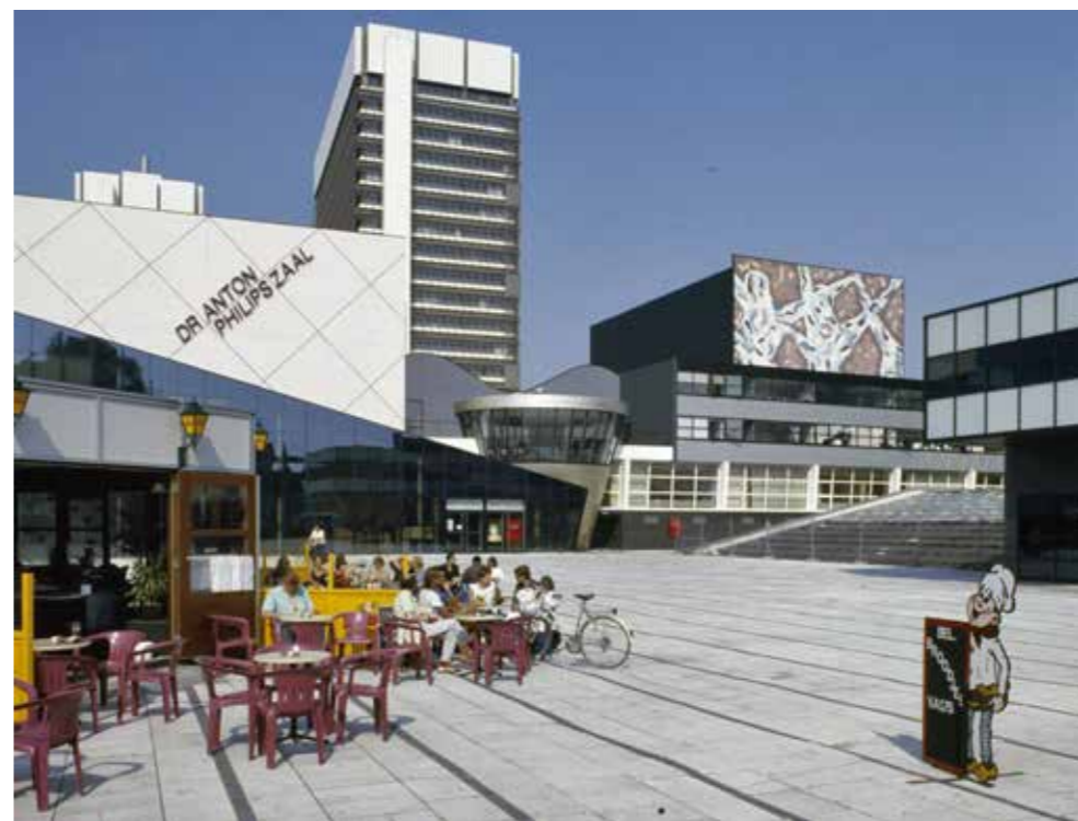
DR. ANTON PHILIPSZAAL Van Mourik Vermeulen architecten 1987-2015