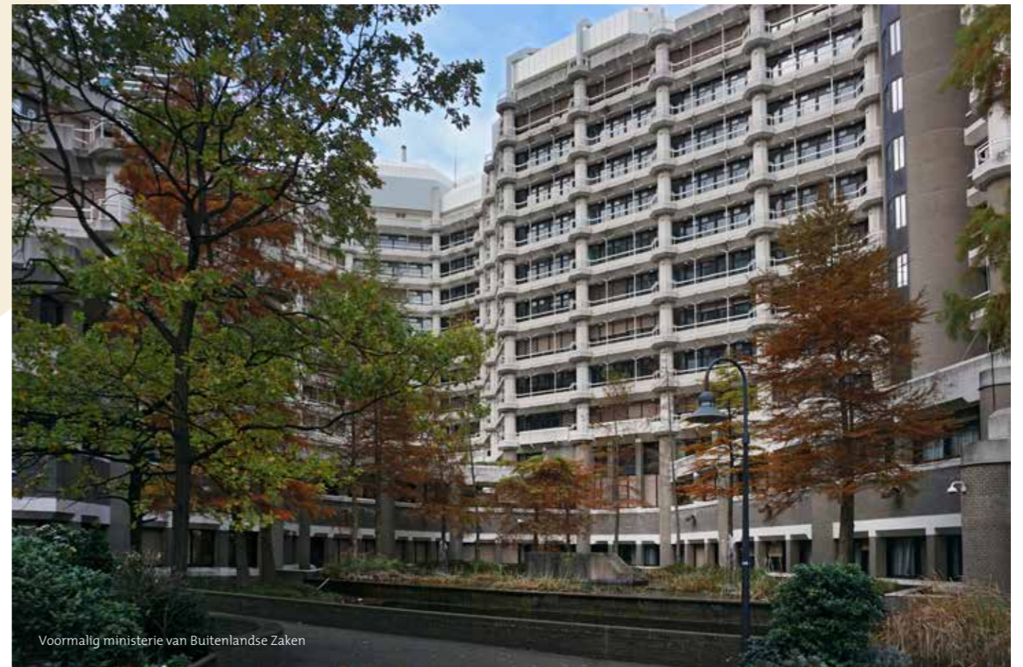
Voormalig ministerie van Buitenlandse Zaken